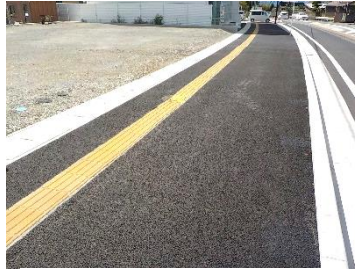
水窪深良線 施工箇所