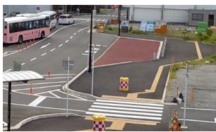
電線共同溝設置工事箇所