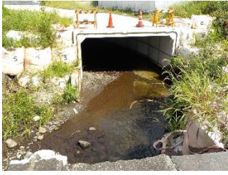
令和4年度施工予定箇所