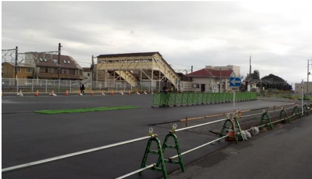
工事の様子(10月15日現在)

令和3年3月に使用開始予定の新しい駅前広場の整備にあたり、整備期間中に臨時で使用する広場を先立って築造します。臨時駅前広場の完成及び使用開始は12月上旬を予定しております。 一般車(優先者乗降場を利用するものは除く。)はロータリーへの進入はできません。一般車乗降場をご利用の場合は上図の経路を通行してください。