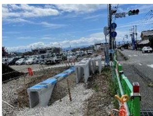
水窪深良線 施工中の様子