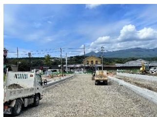
桃園平松線 施工中の様子

令和2年度に引き続き 西側の工事を進めています。 西側の開通は令和3年 末頃を予定しています。