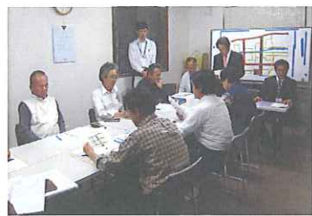
平成24年度第1回区長連絡会の様子

※区長連絡会では、裾野駅西土地地区画整理事業区域内の8区の区長に年に数回お集まり頂き、連絡事項を説明しております。