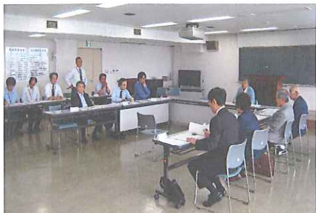
第27回土地地区画整理審議会の様子

平成24年5月31日に第27回裾野駅西土地地区画整理審議会が開催されました。今回の審議会では、①事業見直しにおける「裾野市事業評価監視委員会」からの答申の内容②平成24年度事業予定について報告と説明を行いました。