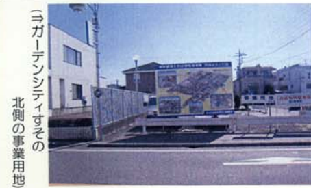
(→カーテンシティすの北側の事業用地)

【完成イメージ看板を設置】 市では、平成19年3月に裾野駅西土地区画整理事業の整備後のイメージ看板を4ヶ所に設置しました。 場所は、JR裾野駅西口、カーテンシティすの北側の事業用地、裾野市役所正面玄関東側、施行地区南西の事業用地(中駿木材南側)です。