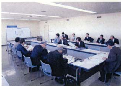
【土地区画整理審議会】

「事業計画の変更の公告」をしました。 昨年12月に縦覧をした「事業計画の変更」が、3月7日に静岡県都市計画審議会で審議されました。35通提出された意見書は全て不採択との答申を受け、変更認可の手続きを行ないました。 その中で、平成19年4月2日に事業計画の変更の公告(裾野市公告第12号)をし、この変更に基づいて、仮換地の指定等の事業を進めていきます。