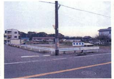
【仮設住宅を建設予定】

(→仮設住宅建設予定地) 市では、平成19年度の仮換地指定を皮切りに、今後、ますます本格化する建物移転に対応するため、今年度、施行地区南西の事業用地(中駿木材南側)に4世帯分の仮設住宅(鉄骨造・3LDK)を建設します。 【権利関係の届出】 施行地区内の宅地について、登記簿では確認できない未登記の借地権などの各種権利の届出をお願いしております。 ※土地区画整理法で届出の義務が規定されています。