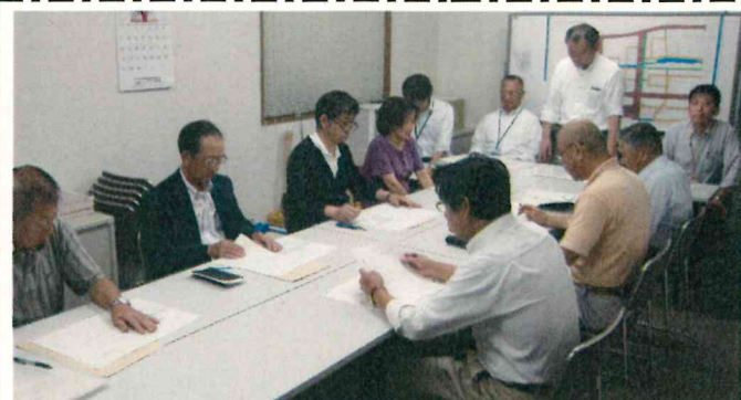
区長連絡会の様子

平成27年6月19日に今年度の第1回区長連絡会を開催し、①本年度の工事予定②引継事項③事業の進捗状況④事業進捗に係る行政区、学区の考え方⑤JR裾野駅バリアフリー化事業 右記5点について、ご報告、ご説明させていただきます。