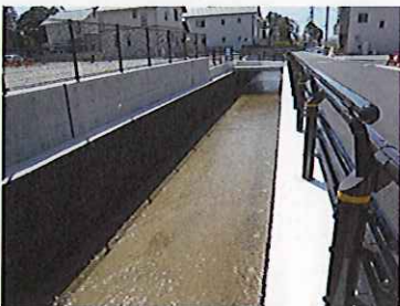
三間堀川竣工箇所