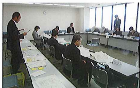
第28回土地区画整理審議会の様子

通知書を対象権利者へ送付しました。この通知手続きは、平成25年2月22日に開催されました第28回裾野駅西土地区画整理審議会において、第8回仮換地指定の箇所、面積、減歩率等について意見を求めた結果、原案通りとの答申を受けたことにより行ったものです。