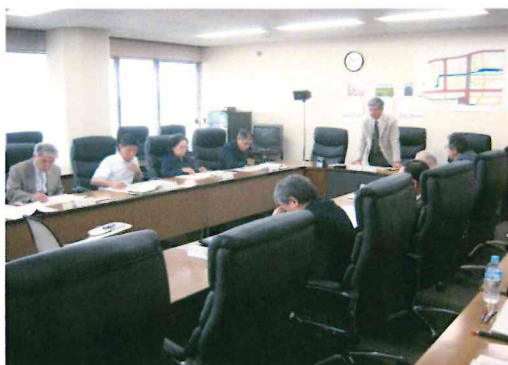
第36回審議会の様子

⑫裾野駅バリアフリー化設備等整備事業 平成28年8月～平成29年3月 施工：JR東海