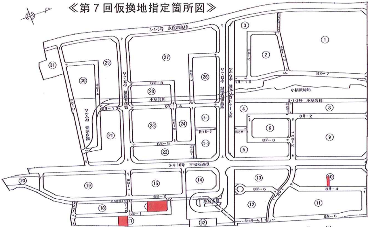
《第7回仮換地指定箇所図》