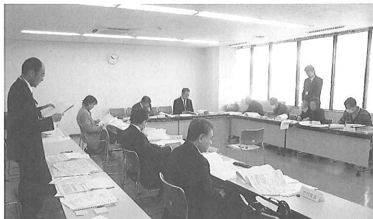
第28回裾野駅西土地区画整理審議会の様子

平成25年2月22日に第28回裾野駅西土地区画整理審議会が開催され、第8回仮換地指定の諮問が行われました。また、事業見直しについて・建築行為等の制限における許可基準の緩和について報告と説明を行いました。