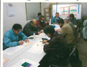
区長連絡会の様子

平成27年2月18日に26年度3回目の区長連絡会を開催し、26年度の進捗状況や、27年度の区長の方々への引継事項についてご報告、ご説明させていただきました。