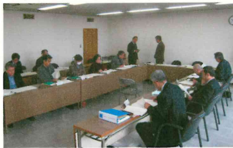
第31回審議会の様子

また、審議会では仮換地指定の軽微な変更、平成25年12月12日に開催された評価委員会、事業見直しの進捗について報告、説明をいたしました。