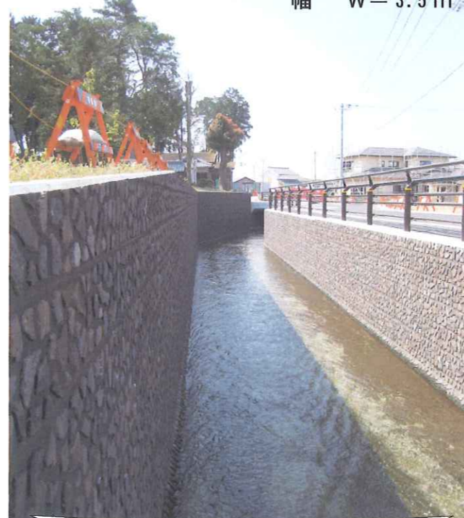
(準)三間堀川河川改修工事