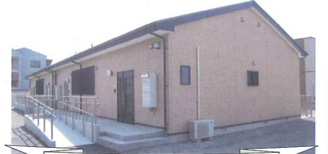
仮設住宅建設工事