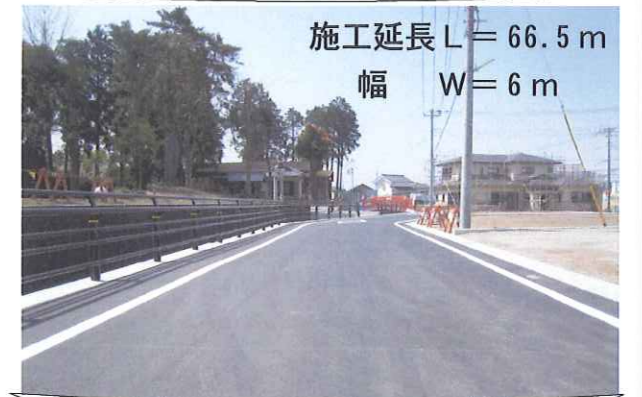
6M-2号線道路築造工事