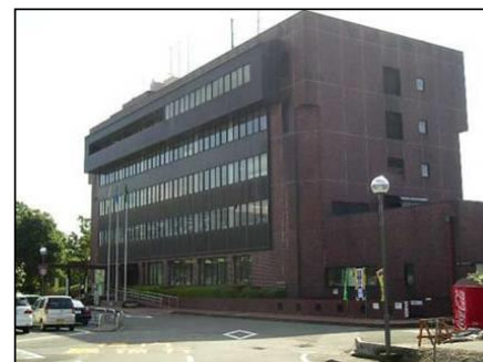
裾野市本庁舎 (耐震改修工事)