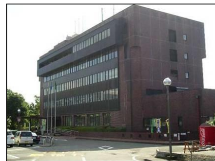
裾野市本庁舎 (耐震改修工事)