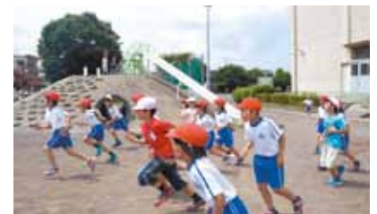
向田小と東小の交流授業

答 寄附者自己負担分の2,000円、国や県へ納付される税金分等が市に寄附されるので増収となる。