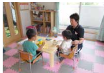
病児保育を扱う小児科（函南）

コスト、期間、街区ごとの合意形成成熟度、費用対効果等、総合的な判断の中で施行計画を作成し、工事着手していく。