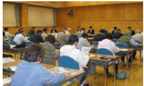
▲須山研修センター