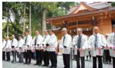
富士登山道須山口開山式

提案 一人の避難支援者が要援護者複数人の担当になっている場合が考えられる。避難の確実性を高めるためにその実態調査をし、改善を求める。