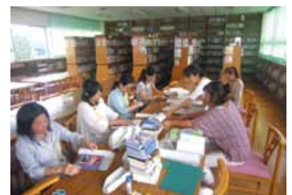
図書ボランティアの活動（東中）

答 裾野駅西土地区画整理事業は、道路づくりも含めた市街地整備手法であり、公共施設と宅地の総合的整備で優れた都市空間を形成する代表的事業と考えている。事業区域は当初計画区域17.6ヘクタールとする。