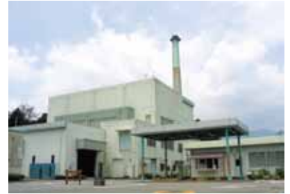
美化センター（大畑）

一時的に食糧に困窮している者に対して、フードバンクを利用した食糧提供の仲介役をしている。