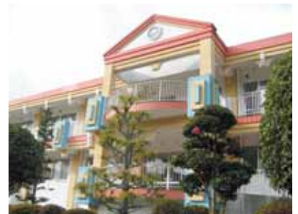
福祉避難所として指定されている富岳一ノ瀬荘

保育園・幼稚園の指定に向け検討する中で、設備や運営面でさまざまな課題も明確になってきている。これらをクリアしながら進めていきたいと考えている。