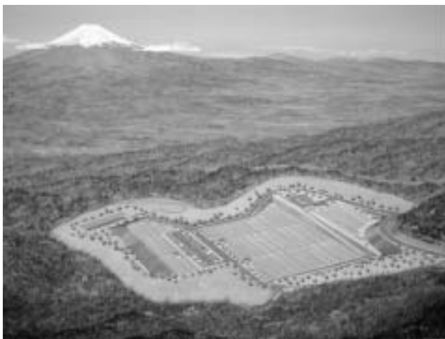
「市営墓地」イメージ図