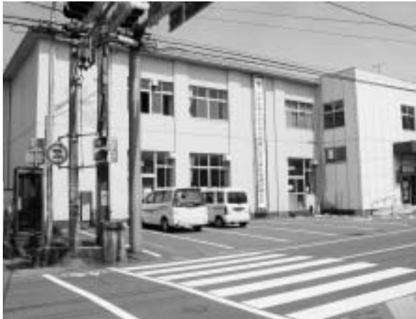
勤労青少年ホーム