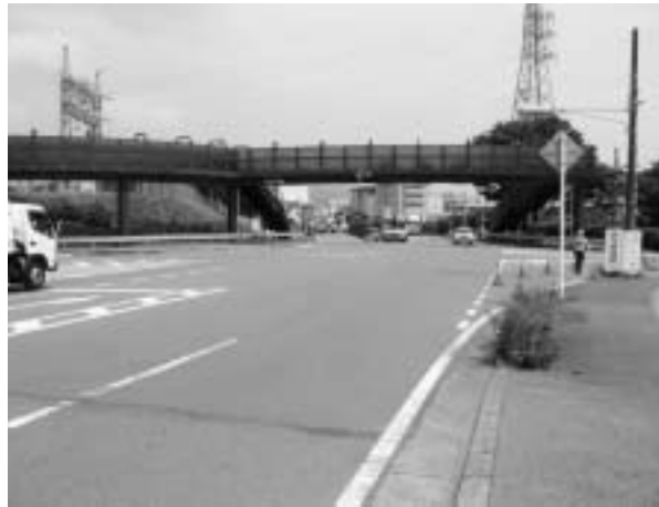
裾野 I C 交差点付近