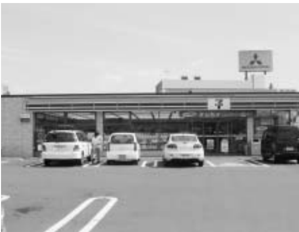
水道料金が納付できるコンビニ

答 コンビニ収納にかかる経費と利便性のバランスを考慮して検討する。軽自動車税については早期導入に向けて検討していきたいが、他の税については問題点を研究。