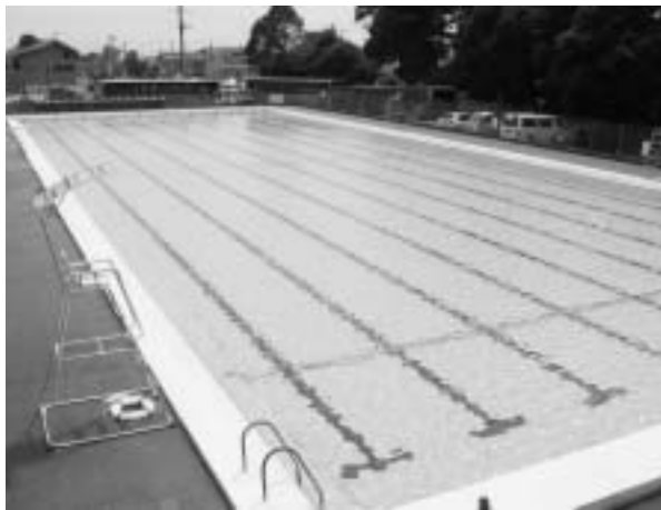
市立水泳場の50mプール

質 健康文化都市を掲げる当市の文化振興策が立遅れていると、文化団体関係者から言われる。どう考えるか。