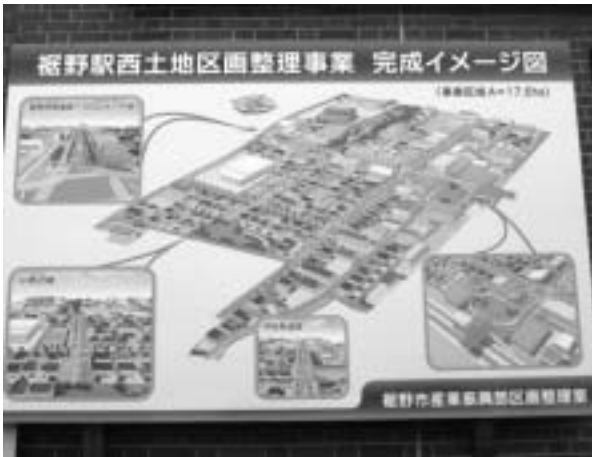
区画整理イメージ図