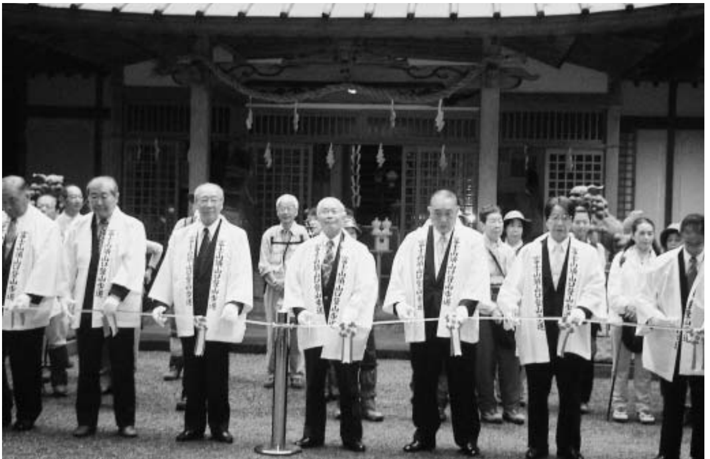
富士登山道須山口開山式