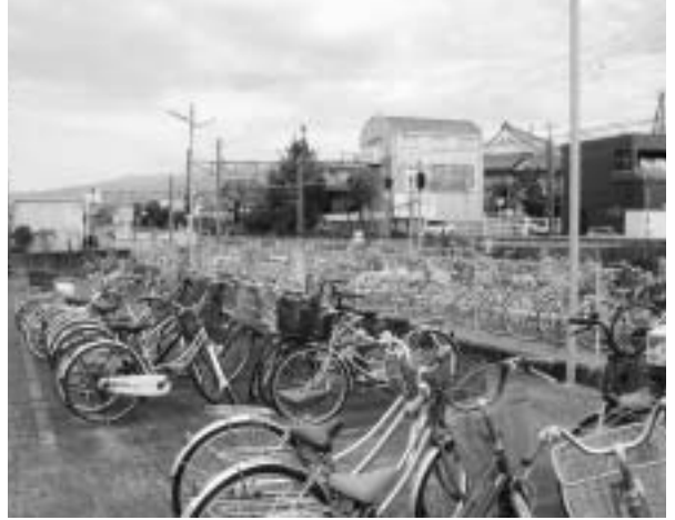
裾野駅西側駐車場

この条例は自転車、自動二輪車を容易に駐車させるため、市が設置した駐車場の管理及び利用方法に関し、必要な事項を定めるものです。