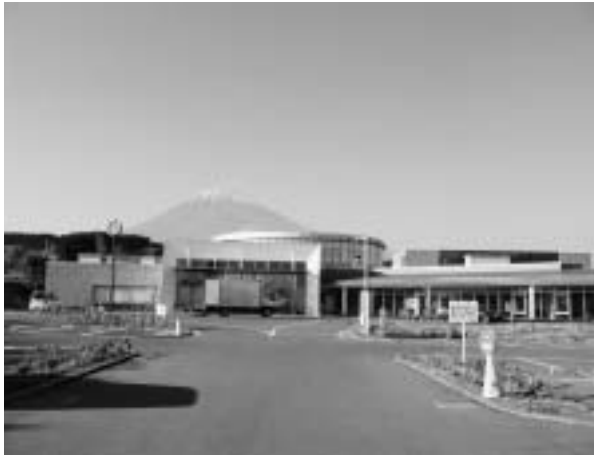
ヘルシーパーク裾野