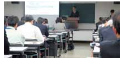
プロジェクトチームによる発表