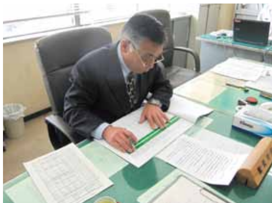
議会選出の杉本和男議員