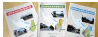
東・西地区道路整備計画

答 昭和55年より21路線の都市計画決定を行い、現在までの整備率は67.1%である。平松深良線及び関連市道の整備は実施していく。東・西地区市街化区域道路整備計画に基づく市道整備も実施し、既存施設の維持修繕も実施していく。