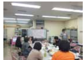
市民活動センター（福祉保健会館内）

答 平成26年度以降、健康福祉部以外の26事業についても調整を実施している。今後も申し出があれば随時内容を検討したい。