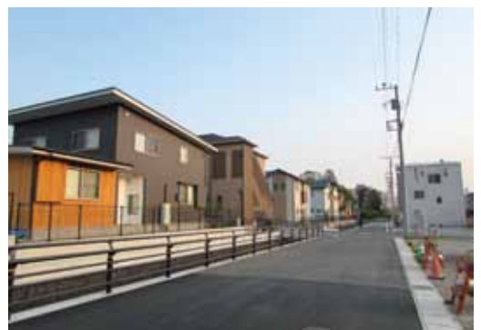
土地区画整理が進む裾野駅前 (平松)

手法が認められている。平成27年度策定完了予定の都市計画マスタープランの見直しの中で、取り組んでいきたい。