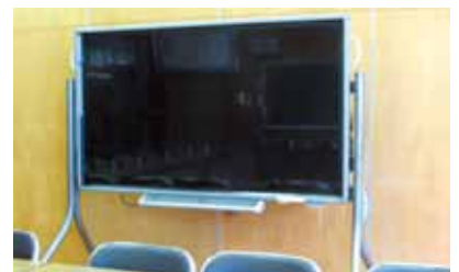
向田小で使用されている電子黒板

答 総務省から新モデルがどのような方式になるのか、整備期日はいつまでかなど公会計制度の統一方針が発表されていない。判明した時点で対応する。