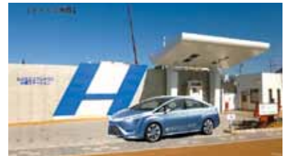
豊田市水素ステーションとトヨタ自動車FCV東京モーターショー出展車とのイメージ写真

情報交換の場としての話し合いには、傍観者としての場に居合わせることでなく、当事者として意見表明することが重要。地区行事の企画運営に多くの市民を巻き込んでいくために、話し合いの仕方を変え、まちづくりに対する気づきと共感を呼び起こす必要があると考える。