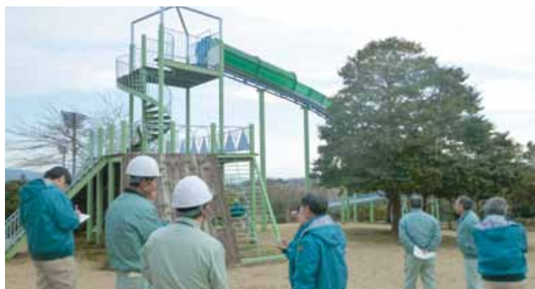
現地視察（運動公園内のローラー滑り台）

一般会計予算、国民健康保険特別会計予算、後期高齢者医療事業特別会計予算および介護保険特別会計予算について、討論はなく、全委員賛成で可決された。