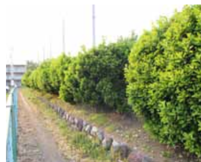
裾野高校南側の狭い道路（佐野）

く、幅員が約4メートル。そこから東側に行くほど狭くなり、中間では最小幅員3メートルになってしまうため、なかなか整備できない。重要な道路であり、地権者の同意をいただけるような努力をしていきたい。