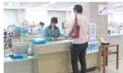
市民課の窓口風景

答 今回のような降雪の影響により中止となるコースより、天候の影響が少なく、選手・応援者の安全面の確保など、実施可能なコース選定が必要と考えている。