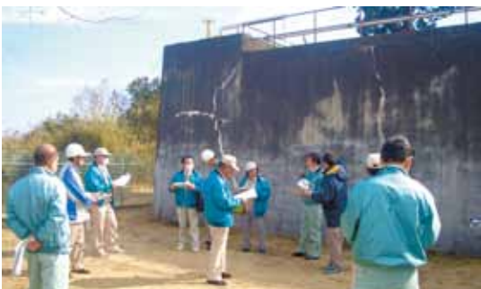
現地視察（御宿配水タンク）

十里木高原簡易水道特別会計予算、下水道事業特別会計予算、水道事業会計予算は、討論もなく可決された。