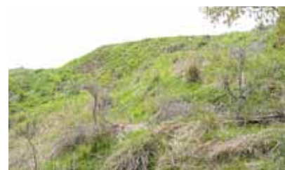
東中学校南側の斜面

況になっても土地所有者から契約を終了する旨の申し出等を行っていない経緯も見られるため、市顧問弁護士に相談した。契約は有効性があるという見解だった。土地所有者の方がこれ以上の土砂の搬入を望まないのであれば、早急に契約を終了させることも手段の一つと考えている。