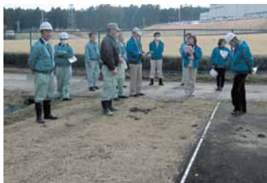
現地視察（最終処分場建設予定地）