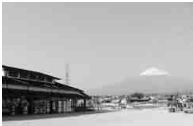
道の駅イメージ（道の駅ふじおやま）

答 圃場整備は地域住民と調整をし、積極的に進めていく。道の駅設置は確かにメリットがあるが、それを活かすためにも立地場所に十分な精査が必要と考える。交差点改良は圃場整備においては必要がないと考えている。