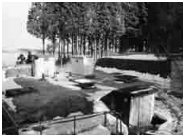
十里木高原簡易水道の施設 (須山)