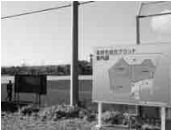
総合グラウンド (御宿)