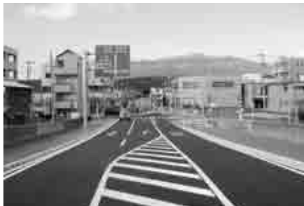
12月16日に開通した佐野茶畑線

○裾野市グラウンド条例の一部 を改正し、裾野市総合グラン ドに建設中の多目的競技場の 利用料を定めました。