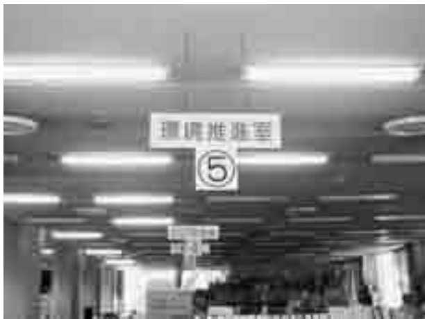
CO 2 の削減を推進（環境推進室）

なされているか。 答 地域の特性に適した省エネルギーの推進方針と具体的な方策を裾野市省エネルギービジョンで示していく。 2012年までに、国の目標6%の削減を裾野市でも達成できるか。 質 家庭部門と業務部門（産業・運輸部門以外）が高い増加率と推計され削減目標達成は難しいと思われる。