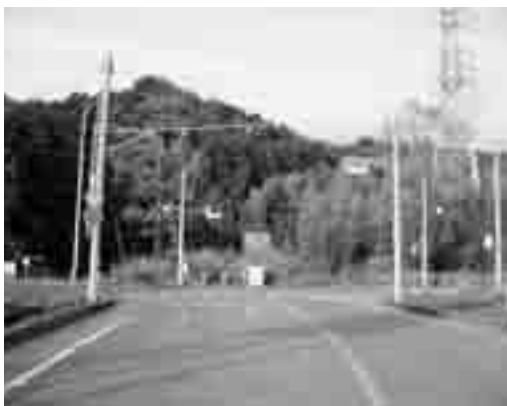
市道1-4号線 (深良地先)