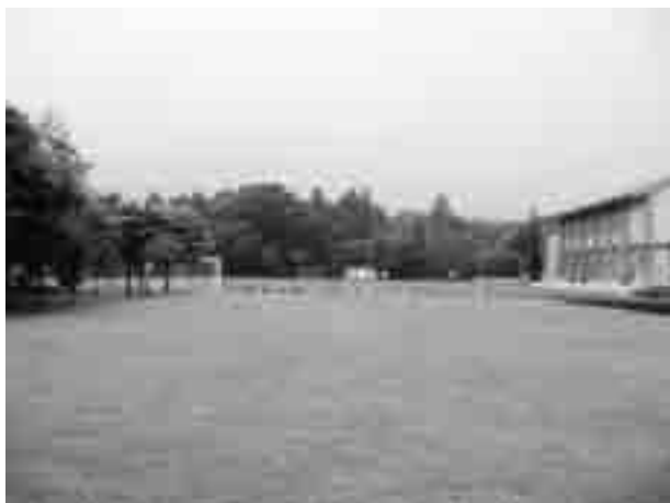
芝生の広場 (須山小学校)

答 静岡県でも、総合的な行 動計画を策定することに なっている。市町を始めとし た関係機関との役割分担等が 具体的に示されるものと考え る。東部地域では、東部保健 所の指導により対応する。