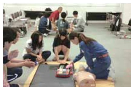
女性消防団員による救急法の講習風景

答 都市計画道路、河川、公園等については、見直し計画案のとおり行いたいと考えているが、県との協議により修正が発生する可能性はある。区画道路は戸別訪問により、権利者の方々の意見を聞いたうえで総合的に判断して変更を検討したい。