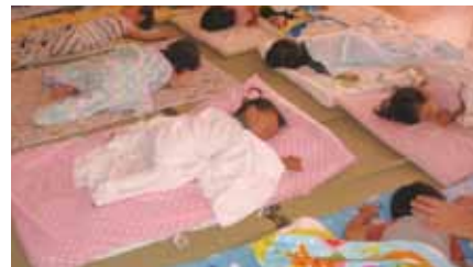
お昼寝中の子どもたち

「子ども・子育て会議」は、 市の子ども・子育て支援策 が地域の子どもや子育て家庭の実 情を踏まえて実施されているかな ど調査、審議する。児童福祉、幼 児教育双方の観点を持った方々の 参画を図る。放課後児童室の条例 は、平成26年度の9月以降の議会 に提出する。