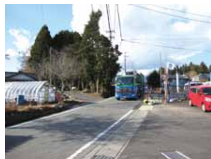
県道 24 号線