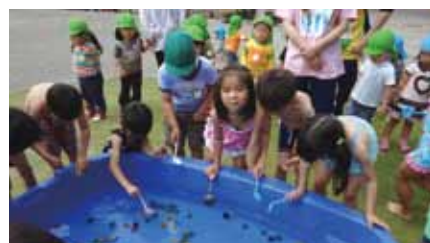
プールで遊ぶ子どもたち

答 予約制度となると、予約を担保するために保育士の確保が必要だが、その保育士の確保に苦慮している現状もある。乳幼児期の子どもを親元でしっかり育てられるような環境を整備するという事は子どもの成育にとっても好ましい状況であるので、他自治体の事例研究等も行っていきたい。