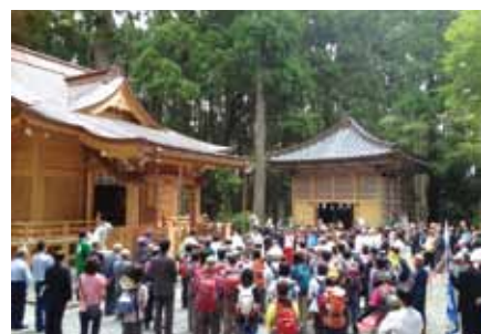
7月1日に開催された富士登山道須山口開山式

答 管理の一元化手法は自治体によって様々ある。先進事例を参考に当市の公共施設に合った手法を検討していく。