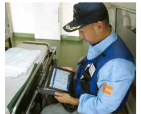
端末を使用しての訓練(消防署)

平成24年度が1,113名で、平成25年度は1,194名と81名の増加となった。