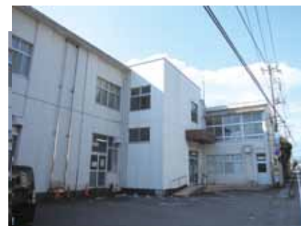
旧勤労青少年ホーム(佐野)

答 利用者への個人負担については、受益者負担の観点等からも、今後負担を求めるよう検討していく。具体的な方法については、関係法令による制約等もあるので、どのような方法が好ましいか関係部署と協議、検討していく。