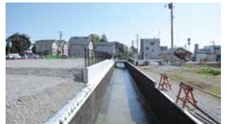
区画整理が進む裾野駅前(平松)

先天的な障害だけでなく、体調や精神的な安定度、家庭での人間関係が原因として挙げられるため、個人個人違う。学校、家庭、医療関係機関等と連携協力し人間関係づくりに努めていく。