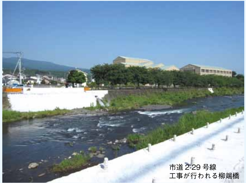
市道 2-29 号線 工事が行われる柳端橋

品質の保証、確認については、品質管理システム ISO 認証取得により品質保証管理体制は充実されている。また、低入札価格調査制度に係る監督体制の強化のため、材料・原寸・仮組立点検すべてを実施し、品質の点検確認などが行われる。