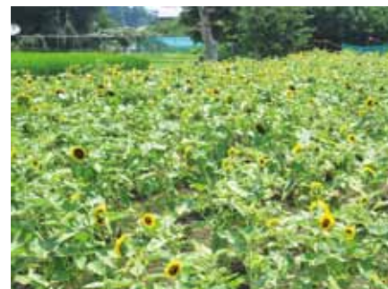
公文名たすとクラブによるひまわりの植栽

益性のある事業であり、5人以上の構成員で過半数以上が市内に在住もしくは在勤し、市内に活動拠点があり市内で活動を行っている団体である。活用を検討していただきたい。