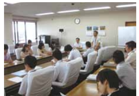
ワークショップ中の庁内横断次世代創造プロジェクトチーム

工事価格は工種等で変わるが、2%から5%程度の影響と予想。労務単価は県の積算基準を採用し適切に処理している。