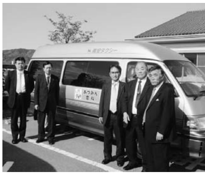
総務委員会（安曇野市）