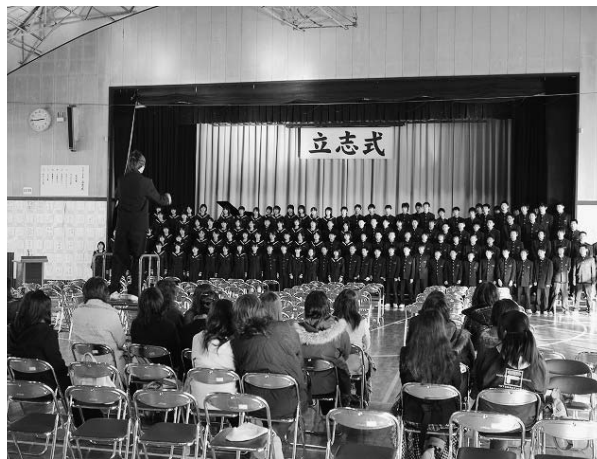
立志式（富岡中学校）

述べることは大変意義のある 教育活動と認識している。ま た立志式は、強い希望や目的 意識を持つて生活することの 大切さを学ぶことのできる効 果的な教育活動と認識してい る。未実施校への普及は、実 施した学校の事例や成果を校 長会を通して紹介し、教育計 画作成の参考にしてもらおう うにしていきたい。