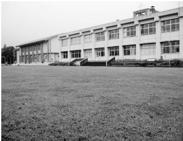
芝生の広場 (須山小学校)

答 園庭全面は困難だが、園庭の一部芝生化については、可能スペースや維持管理の経費・協力体制等を検討し進めていきたい。