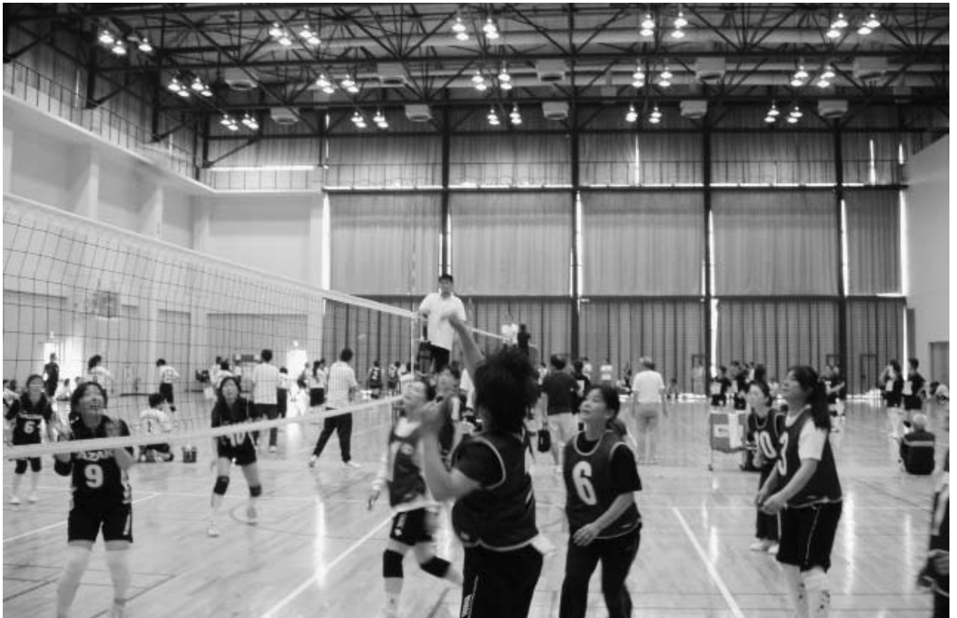
市婦人バレーボール大会