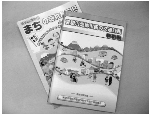
東駿河湾都市圏の交通計画報告書

答 市町別、市町間のトリップ数（移動数）は裾野市周辺で増加。公共交通では、鉄道移動における満足度がバスより高い。JR御殿場線を軸に、公共交通の利便性と適切な土地利用を図る上で、新たな交通拠点の設置検討を進める。