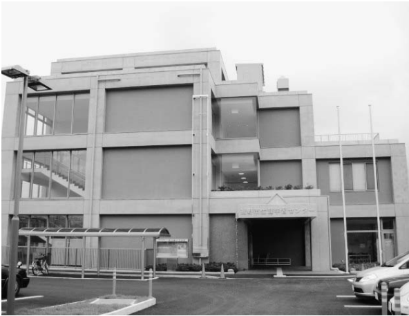
生涯学習センター（深良）

質 体がある。これらが繋がりあい、市民主体のまちづくりをしていくため、部局間の連携を図っていききたい。