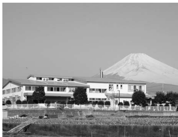
学校給食センター（深良）