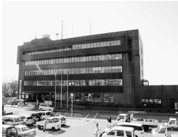
新公共経営に取り組む（市庁舎）