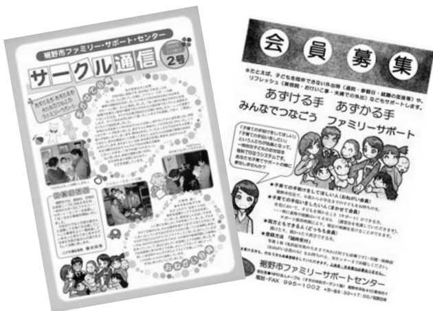
ファミリーサポートセンターのパンフレット

答 ウェルネスによるまちづくりの実現に向け、全庁的なチームを、職員からの公募で作る予定は。