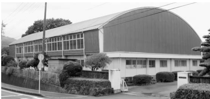
新築される西中学校体育館