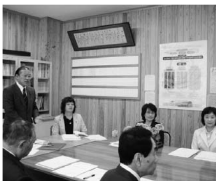
文教消防委員会（小林市）