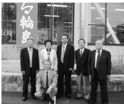
厚生委員会（輪島市）