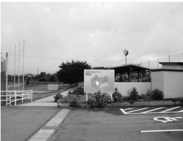
総合グラウンド（御宿）

答 基本指針は、庁内プロジェクトチームで原案を策定した。推進計画の策定には、市民や地域団体などの協力と連携が不可欠である。早い段階からの協力をお願いする。