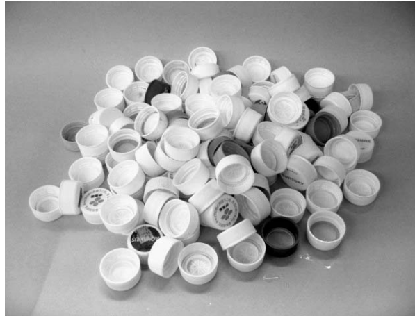
ペットボトルのキャップ

遊休農地解消の打開策として、学校教育・食育と関連付ける事は意味あるものと思っている。実現には、支援体制づくりが必要と感じているが、取り組み方法について学校の意見を聞き、また、遊休農地の活用について農林振興室と協議し、研究していきたいと考えている。