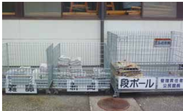
民間業者による資源ごみ回収 (今里)

を条件に、できるところからやっというのが前提であり、国や県に対して最終処分場の確保受け入れの要請をすることは、市長会の一員として賛同した。