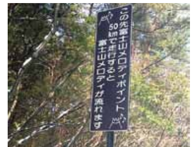
メロディーロード (富士スバルライン)

答 『バル』や『街コン』の主体は商店街であると考えている。飲食店等を主体とした商店街の皆様の熱意を期待したい。