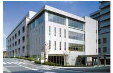
ファルマバレーセンター (長泉町)

先進事例や近隣市町の状況や効果を研究し、当市がどのような形でフィルムコミッション事業に取り組んでいくか前向きに検討していきたい。