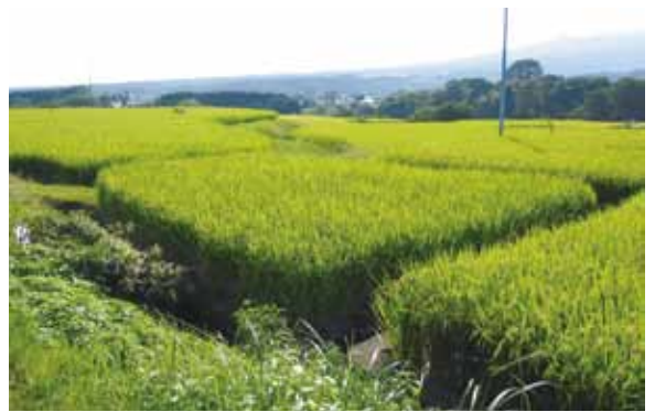
圃場整備予定地区

答 本事業は県営事業であり、事業主体である静岡県に対し情報公開の規定に基づく手続きにより、開示を請求することになる。