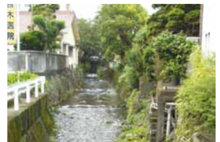
裾野駅西地区の情景

答 現システムでは、当市は計算領域外のため放射能の影響の測定が現状ではできない。範囲の拡大を要望している。また県としても国に要望していると聞く。当市も県と連携を図りながら情報の収集・共有化に努め、原子力対策に対応していく。