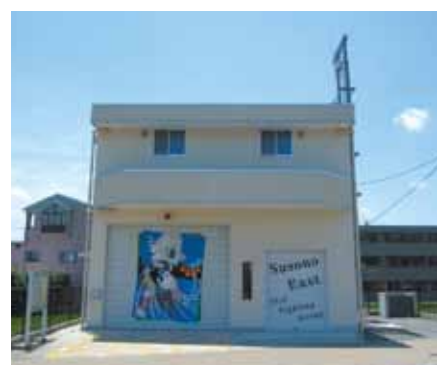
消防東分団茶畑詰所

消防関係者や地区役員の皆様の努力により、定数を満たして辞令交付が行われた。安心と活力ある裾野の実現に努力していきたい。