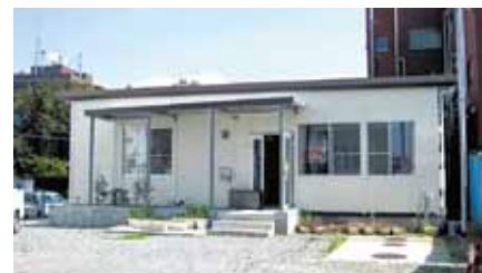
解散した(株)ガーデンシティすその

地域のまちづくりの役割を大いに期待していた。各種自主事業には一定の効果があったが、会社として利益は上がりず、多くの株主の同意で解散する。これまでの事業継続の判断は会社によるもの。