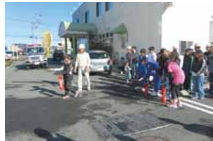
地域防災訓練 (佐野上宿)

答 家族で防災に関する話をすることは大切であるとする。地域防災訓練など、さまざまな機会を通じて、防災について家庭でも話し合うようPRしていきたい。