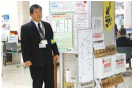
フロアマネージャー「あんないくん」