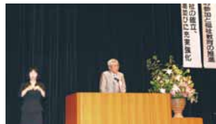
社会を明るくする推進大会

住民不安払拭のためスピード感を持って見直し作業に取り組み計画変更案を策定し、国や県と協議を行っていきたい。