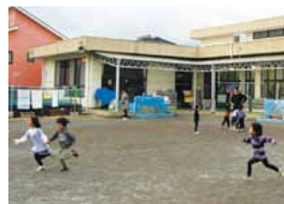
園庭で元気に遊ぶ子どもたち(西保育園)

答 基本構想の策定については11月までに庁内検討会を3回開催し、協議をしている。検討会には公立の幼稚園園長、保育園園長も参加しており、現状や課題、職員の意見等も反映している。