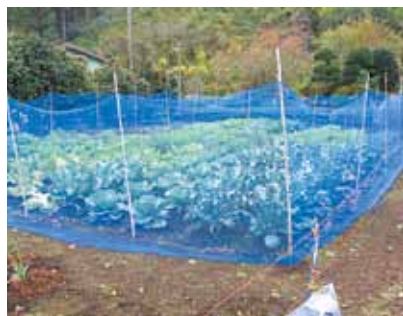
設置された防護柵

被害面積合計321a、被害額136万4千円相当。猟友会へ有害鳥獣捕獲費補助金等を引き続き拋出し支援していく。