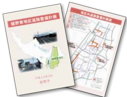
裾野東地区道路整備計画

答 市内には世界有数の優良企業があり、経営等を直接感じることは大変重要と考える。受入れも含めて柔軟に検討したい。