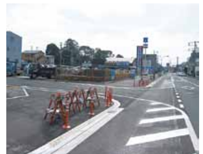
新規出店が進む駅西区画整理地区

答 (株)ガーデンシティすそのに市街地再開発協議会を設置し、地権者と話し合い再開発事業実施に向けて準備をしたが、組合設立までは至らなかった。