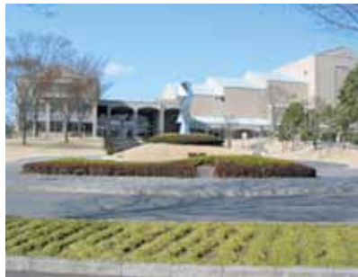
裾野市民文化センター

答 公募の際の選定基準には採用計画等を盛り込んだ。民間の事業計画書の中には双方の合意が図れば採用したいとの提案もある。