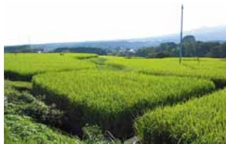
圃場整備予定地区

地理的状况等を考査すると、一般会計予算総額の1割程度の18億円程度は確保しておきたい。また、義務的経費の元利償還金についても18億円程度が見込まれており、これらを踏まえても財政調整基金残高は常に18億円程度の確保が必要。