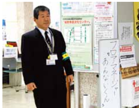
フロアマネージャー「あんないくん」

答 健康推進課は様々な疾病の方との関わりが有り、特定の疾病のみに限定して啓発を行う事は難しいと考える。