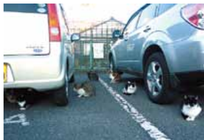
駐車場に集まる野良猫

回答戴けなかった方には、行政案の説明会後に全権利者を個別に伺う予定があり、その際に意見を伺いたいと考えている。