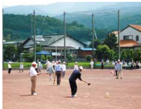
元気にグランドゴルフ (深良グランド)

市民に対して情報が十分でないところがあるので、今後広報紙あるいはホームページ等を活用して広く市民に紹介したいと考えている。