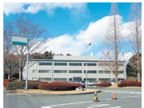
市内大手企業研究所

同時に就労の場を作り、地域で経済を回す発想を参考にして、来年の予算に反映できるものはする。中学生の世代が10年後社会人になった時に、裾野に働く場があるようにしていきたいと考えている。