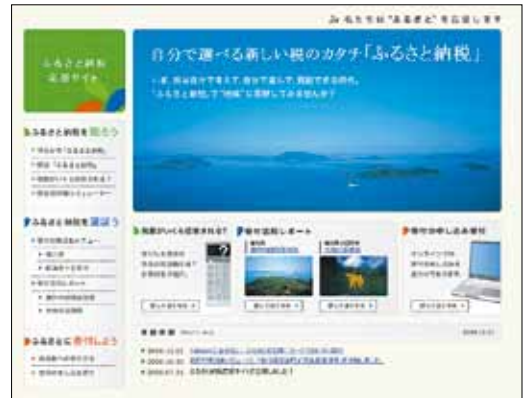
ふるさと納税のホームページ

けて、情報の共有等に努める。研修成果が発揮できる部署へ配属したい。また、財団法人への派遣はあるが、民間企業へは現在のところ派遣していない。