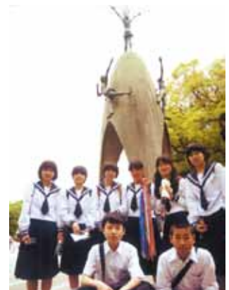
須山中で実施された広島への修学旅行

の恐ろしさや平和な世の中をつくることの大切さを実感として学んだ。この事実を多くの人に伝えていかなければならないという感想を持つことができた。