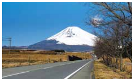
パノラマロードからの富士山

答 本市の財政悪化など、新事業に取りかかれぬ状況である。現時点では、農産物の特産化、観光物産の開発研究や、イベントによる仮設店での販売を拡大し、実効性を高めていきたいと考えている。