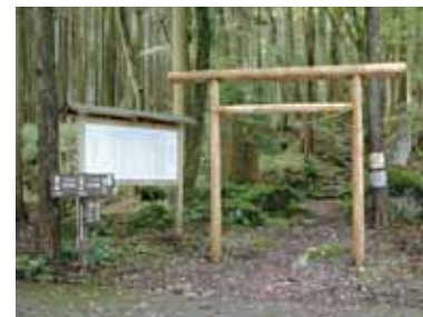
登山道入口の山神社の鳥居

県道三島裾野線を上り、須山集落を過ぎて忠ちやん牧場の少し手前の愛鷹山登山道入口のバス停の所から大沢林道に入る。