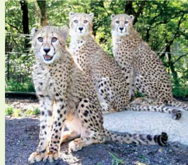
1. 2016年1月誕生のチーター3兄弟。「サファリゾーン」にデビューしました。 2. 「ふれあいゾーン」で遊ぶレッサーパンダたち。 3. くまさんケーキ。1日2組限定で誕生日や記念日をお祝いするプランがあります。