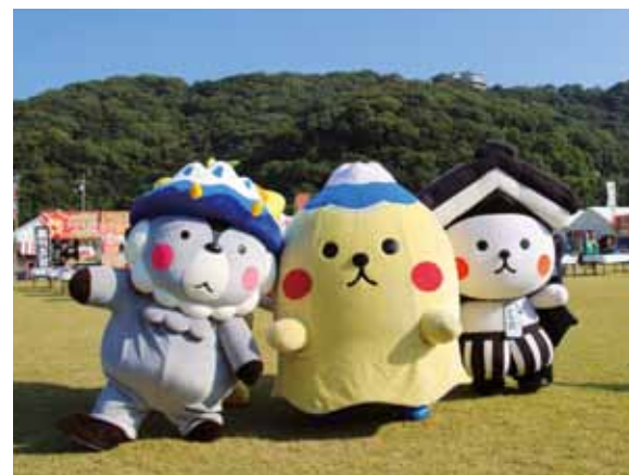
つぶらな瞳が共鳴した「ゆるキャラ®グランプリ」 (愛媛県松山市)