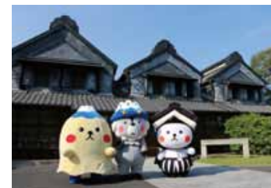
とち介を訪ねて作戦会議 (栃木県栃木市)