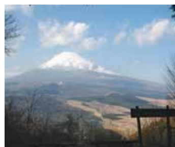
山頂からの富士山

山荘を後にし、急勾配の坂を上ると尾根道に出る。ここが富士見峠で、左に行くと越前岳（2,55㍎）、右に行くと黒岳（2,55㍎）。木立の中を進むと急に前方が開け、富士山側に木製のベンチが並んでいる。ここは展望広場（標高1,000㍎）で、正面に雄大な富士山、眼下に十里木高原が広がっている。