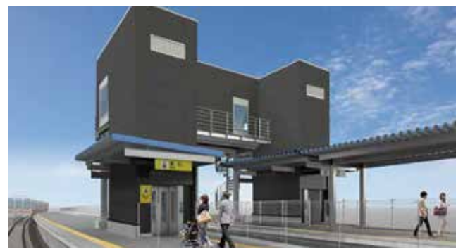
▲エレベーター用上空通路イメージ