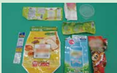
ポリ袋・ラベル類