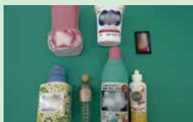
ボトル類 (中を洗う)