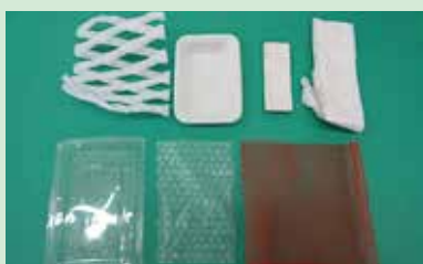
発泡スチロール・緩衝材・ネット類