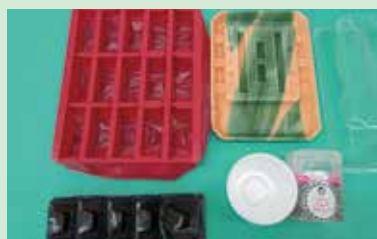
カップ・トレイ類