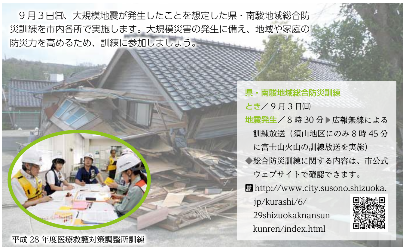
平成 28 年度医療救護対策調整所訓練

9月3日(日)、大規模地震が発生したことを想定した県・南駿地域総合防災訓練を市内各所で実施します。大規模災害の発生に備え、地域や家庭の防災力を高めるため、訓練に参加しましょう。