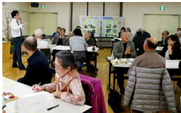
先進事例から地域づくりを学ぶ

麦塚地区で地域づくり活動を行っている麦青会（麦塚青年会）が、県教育委員会の「こどもをはぐくむ地域活動団体表彰」と静岡新聞社の「ふるさと貢献賞」を受賞し、市長に報告しました。39年間の地域での活動が評価されて受賞しました。