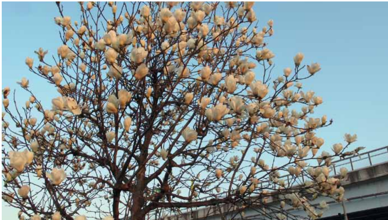
朝日に染まるハクモクレン

長泉町との境にある南部公園前の歩道に、樹高5mほどのハクモクレンが2本植えられています。写真は北側の1本です。満開を迎えた19日の早朝、朝日に染まる白い花びらを撮影しました。背後に写るのは、伊豆縦貫道の高架です。