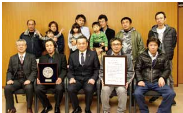
39年間の地域貢献を表彰

長泉町との境にある南部公園前の歩道に、樹高5mほどのハクモクレンが2本植えられています。写真は北側の1本です。満開を迎えた19日の早朝、朝日に染まる白い花びらを撮影しました。背後に写るのは、伊豆縦貫道の高架です。