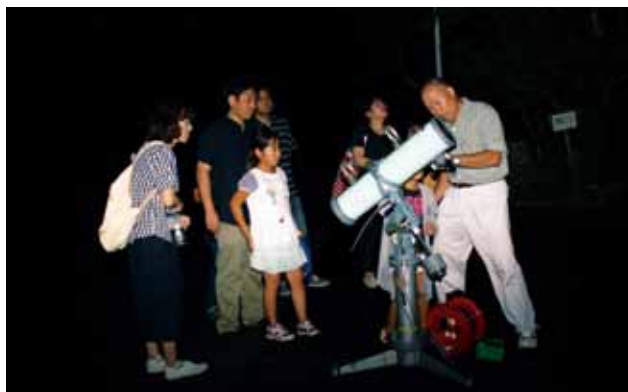
夜の富士山資料館で新たな発見 8月20日

海外友好協会の主催による10周年記念日韓交流チャリティーコンサートが市民文化センターで行われました。カヤグム(琴)やテグン(尺八)などの伝統楽器を演奏し、10年間の交流を祝い、日韓交流の固い絆を再確認しました。