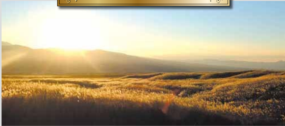
「黄金のじゅうたん」