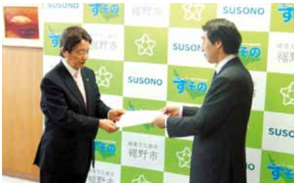
▲審議会会長が市長へ答申書を提出

審議会▶ http://www.city.susono.shizuoka.jp/life/line/water-council.php