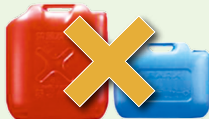
ガソリンの貯蔵には 樹脂製容器は火災危険性が高いので 使わないようにしましょう