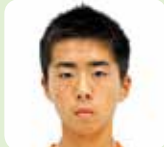
内田 樹 (2)