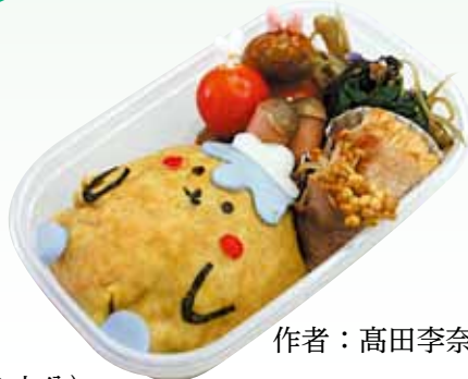
作者：高田李奈さん