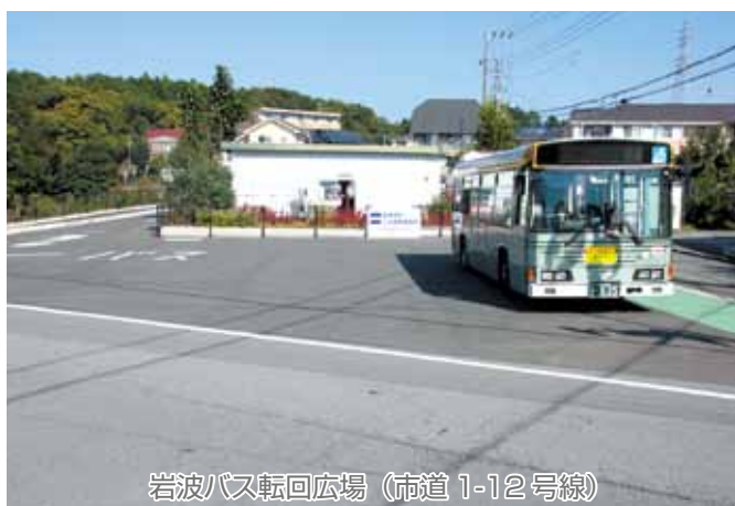
岩波バス転回広場 (市道 1-12 号線)