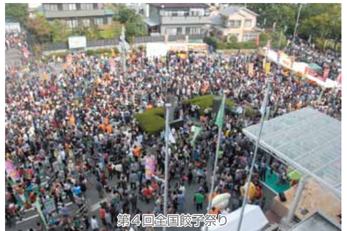
第4回全国餃子祭り