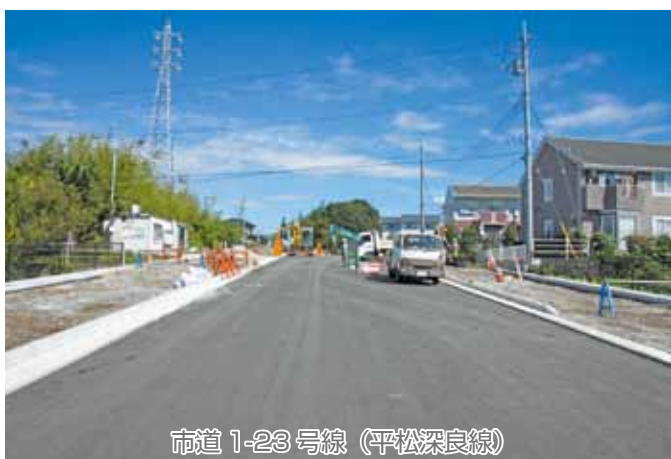
市道 1-23 号線 (平松深良線)