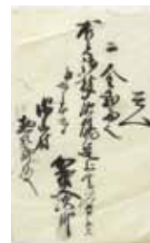
炭焼運上金 (須山区有文書)