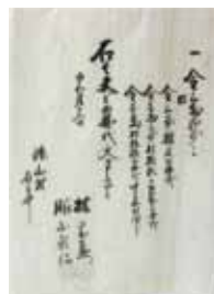
雑木御払い代 (須山区有文書)

貞享3年(1668)の「駿州駿河郡御厨領深山村御指出帳」によると、薪・葎 むしろ ・縄 むかわら ・糠藁などの小物成を金銭で納めていたことが記録されています。須山村は山林が多く、木材業や炭焼き業が盛んだったようで、これらに関係した運上金の領収書が多く残されていました。炭焼きを例にすると、雑木の払い下げ・炭 すみ 竈 がま ・焼き出した炭などそれぞれに運上金が必要で、現在と同様、当時の人々もいろいろな税で大変だったようです。