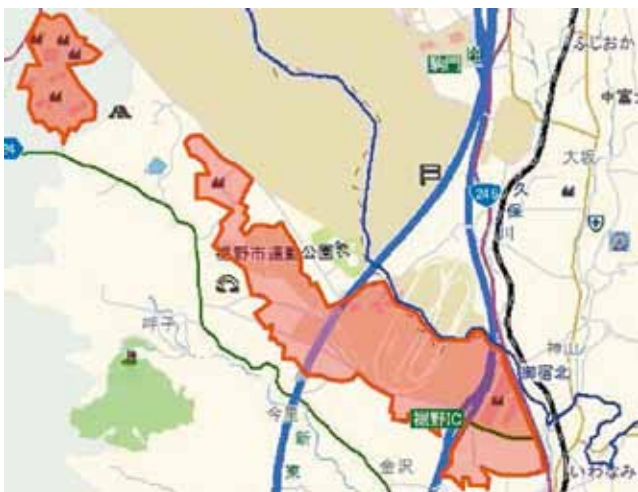
内陸フロンティア推進区域の指定を受けた範囲

これを受けて市では、企業立地推進本部会議を開催し、「企業とともに発展するまち裾野」の実現に向け、全庁を挙げて取り組む方針を決定しました。