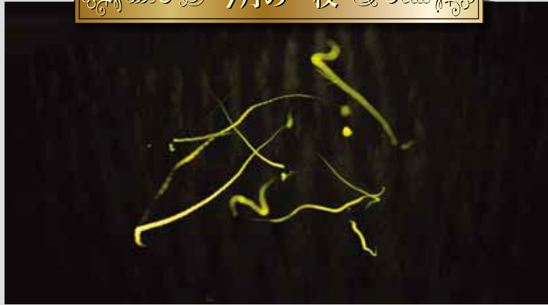
「大畑の田を照らす光たち」